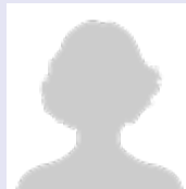
unbesetzt 1. Schriftführerin